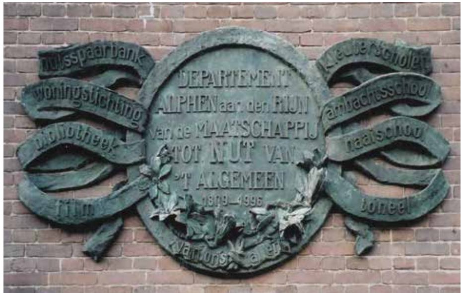
Kunstwerk aan de zijmuur van het Nutsgebouw.

Toch verdween het Nut niet helemaal uit de Alphense samenleving! Het Nutsgebouw aan de Hoofstraat bestaat nog steeds en neemt een prominente plaats in de omgeving in. Ook bleef de Nutsspaarbank (later opgegaan in de Bondsspaarbank) - op een heel andere wijze en met een andere naam - voor de Alphense samenleving actief in de vorm van de Stichting Fonds Alphen en omstreken. Deze stichting droeg oorspronkelijk de naam VSB Fonds Alphen aan den Rijn en omstreken. Dat fonds is ont-