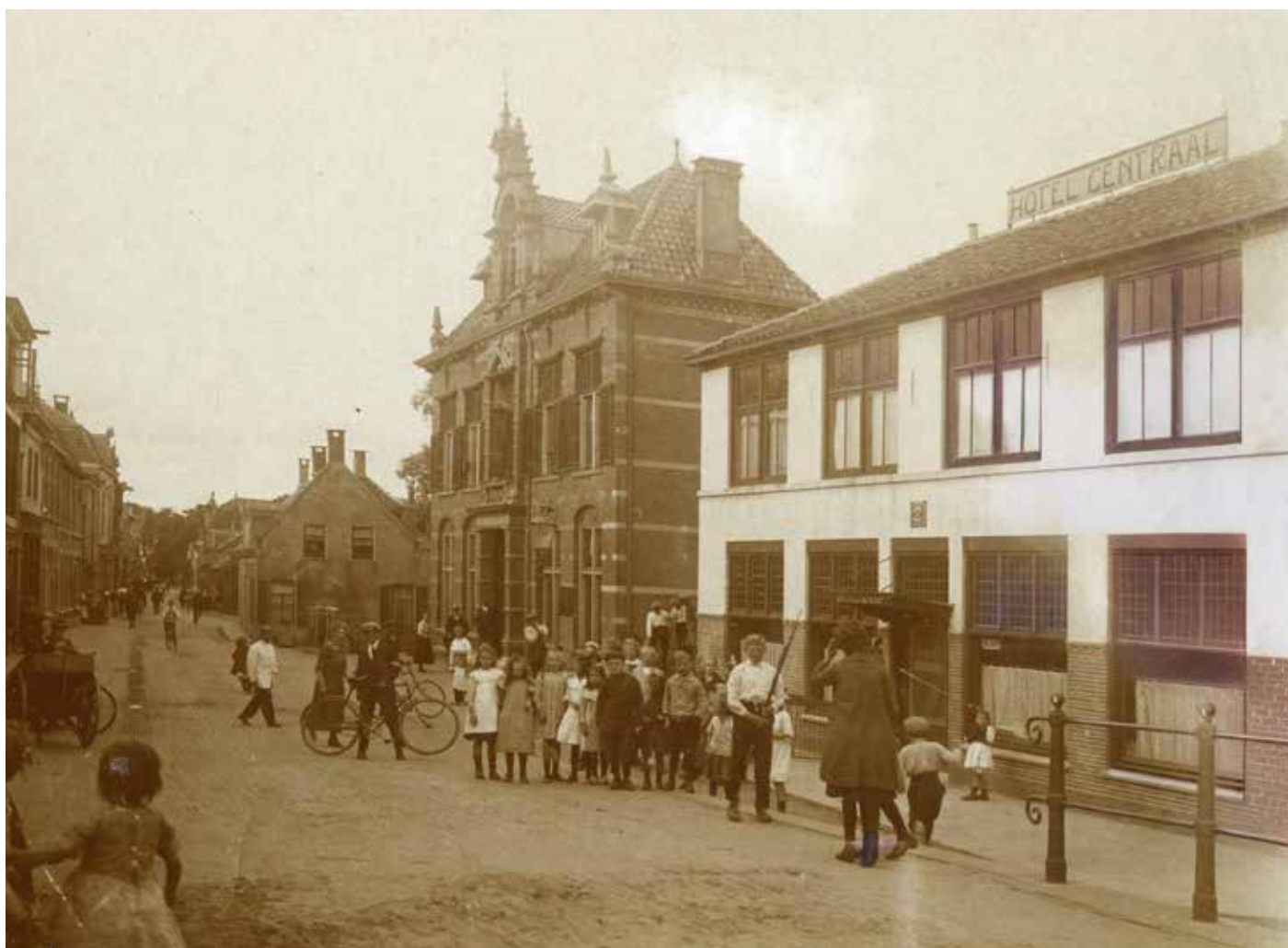
Het Nutsgebouw met rechts Hotel Centraal rond 1920.