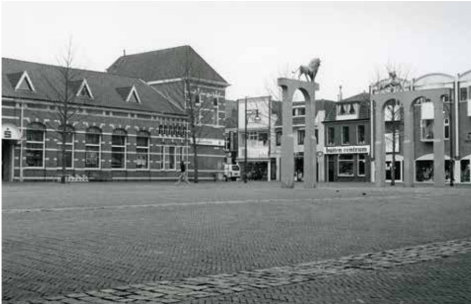
Zijaanzicht van de Bondsspaarbank rond 1990 met op het Thorbeckeplein de leeuw en de tijger op sokkels. Deze beelden staan nu in de Castellumstraat, hoek Paradijslaan.

werd daarom vanaf 1893 aan nutsactiviteiten besteed. In het eerste jaar werd 1000 gulden verdeeld: ten behoeve van lezingen (200 gulden), de ambachtsschool (150 gulden), de bad- en zweminrichting (150 gulden), de bibliotheek (50 gulden), de gymnastiekschool (400 gulden) en het ziekenfonds (35 gulden). De departementskas ontving 15 gulden. Door veranderde bankregels stopten de uitkeringen vanaf 1952.