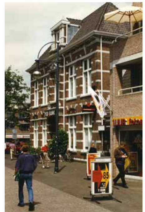
De VSB (Verenigde Spaarbank) in het Nutsgebouw aan het einde van de vorige eeuw.